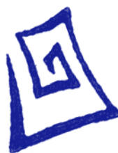
Nr. 313 19 €