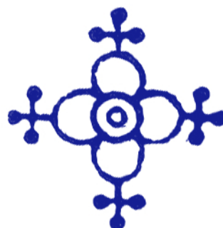
Nr. 501 22 €